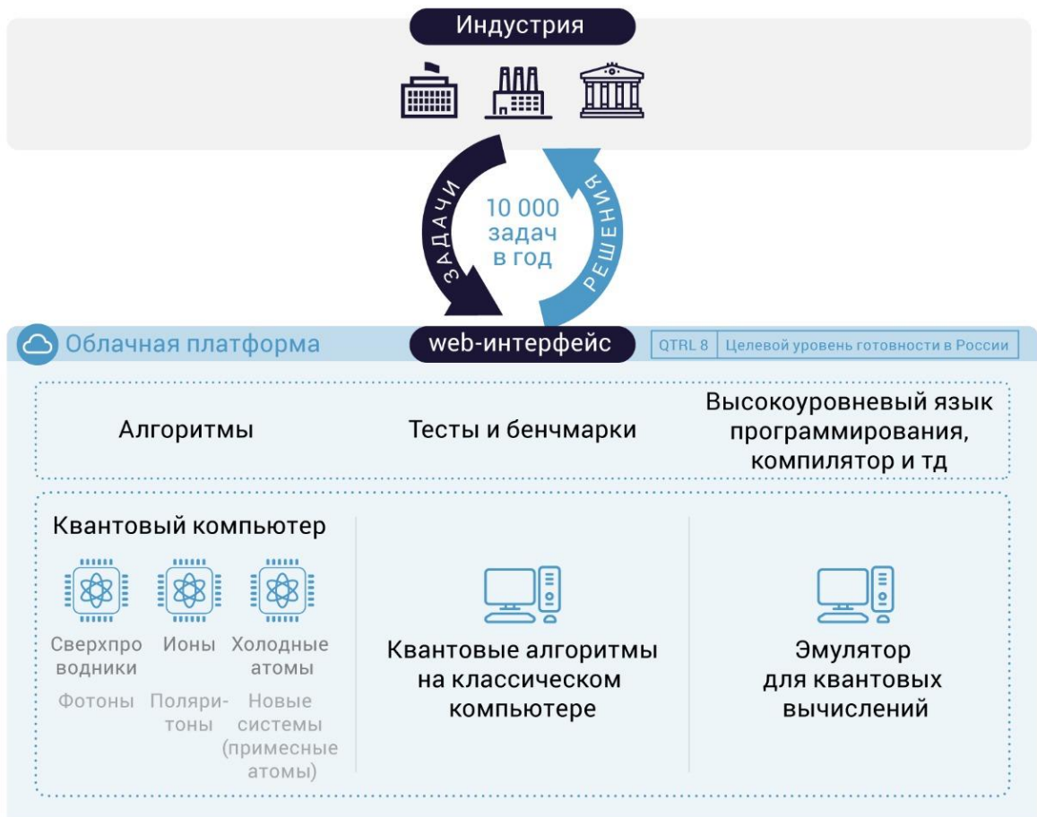
Рис. 1. Квантовые вычисления для решения задач индустрии к 2024 г.

Лидирующие организации: ВНИИА им. Н.Л. Духова; ИАЭ СО РАН; Институт прикладной физики РАН (Нижний Новгород); Институт спектроскопии РАН (ИСАН); ИТФ им. Л.Д. Ландау РАН; ИФП А.В. Ржанова СО РАН; ИФП им. П.Л. Капицы РАН; ИФТТ РАН; КНИТУ–КАИ; КФТИ; КФУ; Московский государственный педагогический университет (МПГУ); МГТУ им Н.Э. Баумана; МФТИ; НИТУ МИСиС; Новосибирский государственный технический университет (НГТУ, Новосибирск); Российский квантовый центр (РКЦ, ООО «МКЦТ»); Сколковский институт науки и технологий (Сколтех); Университет ИТМО (ИТМО); ФИАН им. П.Н. Лебедева; ФТИ им. А.Ф. Иоффе; ФТИАН им. К.А. Валиева РАН; Центр квантовых технологий МГУ им. М.В. Ломоносова (ЦКТ МГУ им. М.В. Ломоносова).