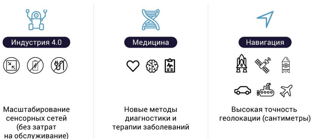
Рис. 3. Области использования квантовых сенсоров в РФ к 2024 г.

Лидирующие организации: АО ИСС им Решетнева; АО РИРВ; ВНИИФТРИ; Время–Ч; ИЛФ СО РАН; ИПФ РАН; ИСАН; ИФТТ РАН; МГУ им. М.В. Ломоносова; МФТИ; НИТУ МИСиС; МИФИ; Объединенный институт ядерных исследований, ФТИ им. Иоффе; ООО «Детектор Фотонный Аналоговый» (ООО «ДЕФАН»); РКЦ; Университет ИТМО; ФИАН им. П.Н. Лебедева; ЦКТ МГУ им. М.В. Ломоносова; Центр перспективных технологий и аппаратуры.